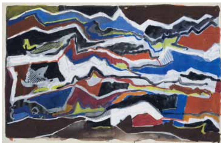
'Landschap', gouache, 21 cm x 29,5cm, 1968. Prijs: € 350 tot 3.500.