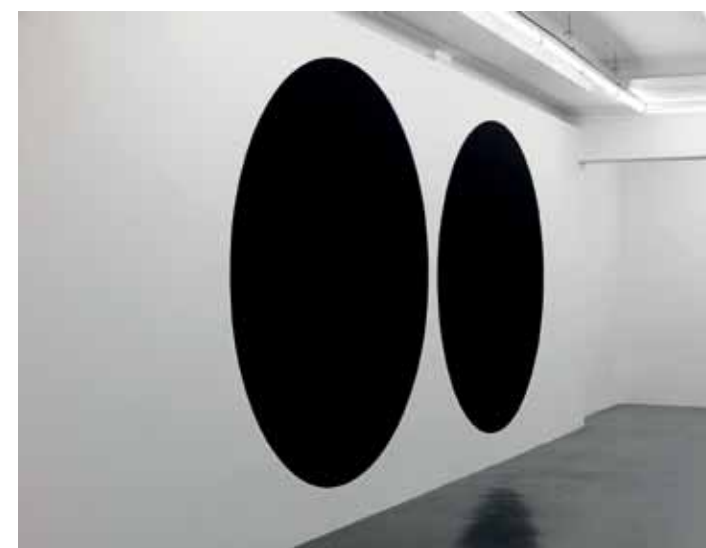
Neil Campbell, 'Daphne II', 2009, acrylverf op de muur, variabele afmetingen, installatie-zicht Office Baroque Gallery, Antwerpen.

Office Baroque Gallery Lange Kievitstraat 48 Antwerpen 28-10 t/m 01-12 www.officebaroque.com