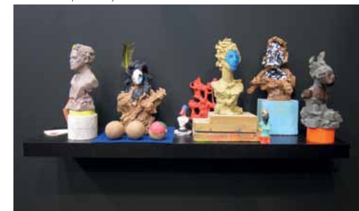
Nadia Naveau, 'Amarcord', 2012, klei, plasticine, tape, 90 x 20 x 27 cm. Courtesy Nadia Naveau & Base-Alpha Gallery.

Base-Alpha Gallery Kattenberg 12 Antwerpen t/m 03-11 www.basealphagallery.com