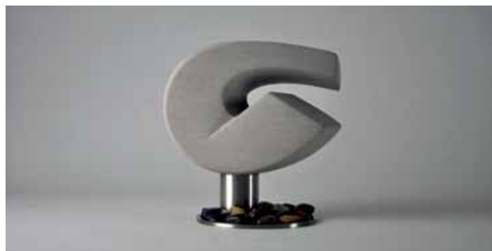
Marc Fugère, 'La Grande Pirouette/De grote pirouette'. © Brenart Art Gallery. Prijs: € 600 tot 12.000.

Archétype/Ampersand House Tasson-Snelstraat 30 Brussel 05-10 t/m 04-11 www.archetype.be