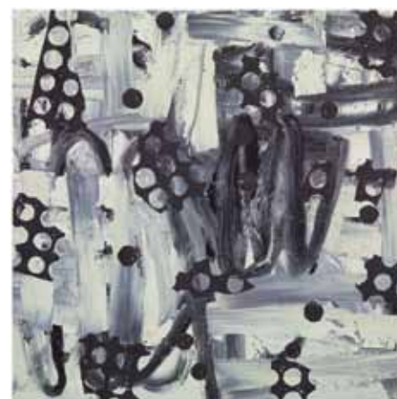
Zonder titel, olieverf op doek, 130 x 130 cm. © kunstenaar. Prijs: € 2.400 tot 42.000.

Yves Zurstrassen (Verviers, 1956), de lievelingskunstenaar van het museum voor hedendaagse kunst IKOB in Eupen, is momenteel te gast in galerie Triangle Bleu. Deze autodidact hanteert al zo'n dertig jaar het penseel. Hij bleef dat doen toen de populariteit van de schilderkunst tanende was en alle blikken waren gericht op de fotografie, de installatiekunst, ... Die volharding werpt nu zijn vruchten af: Zurstrassen bekleedt een prominente plaats in de hedendaagse kunst. Hij is dan ook een uitblinker op alle gebieden: een kleurrijk palet dat je bijna gewaagd kunt noemen, dik opgebrachte verf, en een nerveuze en royale toets die zorgt voor ritme en koortsachtigheid. Op het eerste gezicht ziet het er allemaal spontaan uit, maar vergis je niet: de composities zijn grondig doordacht en nauwgezet uitgewerkt. Indrukwekkender nog is hoe hij even vaardig dezelfde interne dynamiek weet te leggen in de intimistische formaten als in zijn monumentale doeken. (gg)