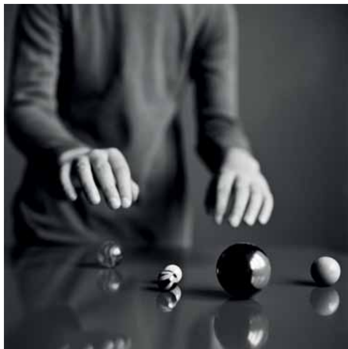
Anne De Gelas, 'Mains au-dessus des billes/Handen boven knikkers', 2010, fotoafdruk op aluminium, 1/5, 100 x 100 cm. Prijs: € 1.000 tot 10.000.