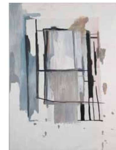
'V, 1', 2012, olieverf op doek, 200 x 150 cm. © Ronny Delrue. Prijs: € 750 (tekeningen) tot € 10.000 (schilderijen).

Wazige beelden of de kunst van het misleiden: Ronny Delrue (Heestert, 1957), een kunstenaar met een gedegen opleiding, is daar een kei in. Hij laat bewust alle herkenbare details van de realiteit achterwege. Zijn aanpak verschilt radicaal van alle andere. Delrue bewerkt zijn thema's van binnen uit. Hij gebruikt een waaier van technieken om te komen tot een grotere universaliteit. "In de tekeningen komt het intense gebruik van afwijzing en gebaren het sterkst tot uiting. Hij speelt er met gedachten en bespiegelingen over zichzelf. Hij gaat op zoek naar de verborgen identiteit achter zichzelf. De figuren in die werken vertonen gelijkenissen, maar tegelijk ook verschillen: ze zijn verwant door de omtreklijnen, maar verschillen als verschijning. (...) (Jan Hoet, 2011). Delrue bewerkt de realiteit om ons op het verkeerde been te zetten.