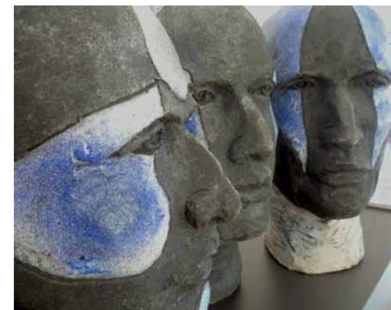
Monica Cantillana, 'Les sentinelles/De schildwachten (detail)'. © Galerie Azur/ M. Cantillana. Prijs: € 400 tot 2.000.

Galerie Jacques Cerami Route de Philippeville 346 Charleroi t/m 20-10 www.galeriecerami.be