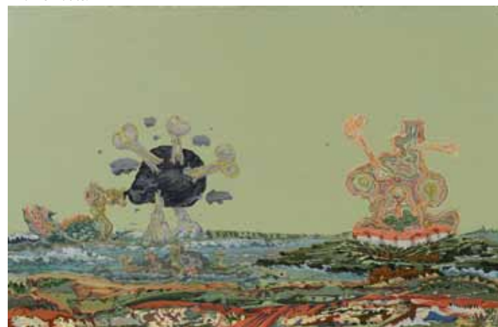
Johan Nobell, 'Soil Eater', 2012, olieverf op doek, 40 x 60 cm.

Stephane Simoens Contemporary fine art Golvenstraat 7 Knokke-Zoute t/m 30-10 www.stephansimoens.com