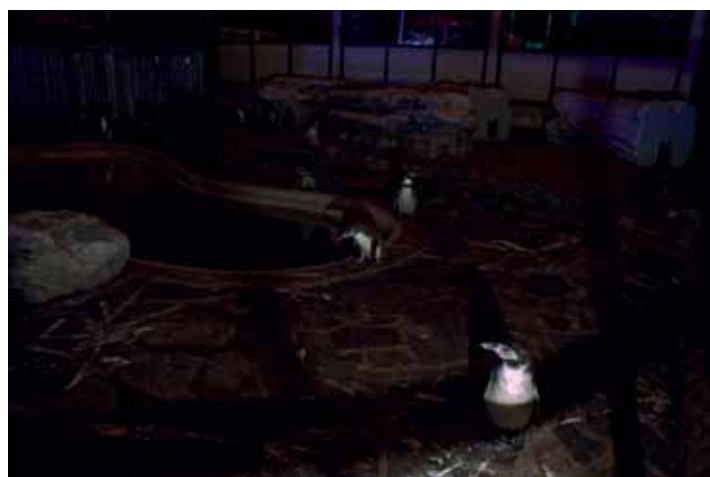
Peter Waterschoot, 'Penguins at the Zoo', 2009. Prijsindicatie: tussen € 300 en € 950, formaten van 25 tot 120 cm breed, oplage van 8, gemonteerd op Dibond, al dan niet ingelijst.