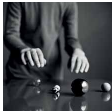
Anne De Gelas, Mains au-dessus des billes, 2010, tirage photographique sur aluminium, éd. 1/5, 100 x 100 cm.

À la charnière de deux époques, Jean-Marie Planque nous livra une production traduisant le tourment de ses contemporains. Un période où le malaise se fit d'autant plus pesant que les plasticiens s'affrontaient tous sur le même terrain: celui d'une révolution artistique sans précédent. Refusant quelconque appartenance à une école ou un courant, l'artiste - observateur attentif - témoigne de son temps. Remarquons également que sa formation de typographe fut déterminante. Lettrines, calligraphies et mises en page sont aux sources de ses compositions les plus fortes. Une production singulière, détachée