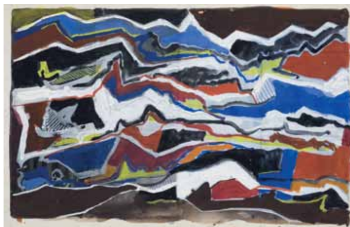
Paysage, gouache, 21 cm x 29,5cm, 1968, © Braam Art Gallery

Galerie Fred Lanzenberg Av. des Klauwaerts 9 Bruxelles jusq. 27-10 www.galeriefredlanzenberg.com