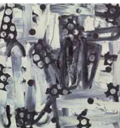
Sans titre, huile sur toile, 130 x 130 cm. © de l'artiste

Enfant chéri de l'IKOB/Eupen, Yves Zurstrassen (Verviers, 1956) est bientôt aux cimes de la galerie Triangle Bleu. Depuis trente ans, cet autodidacte n'a pas lâché les pinceaux. Même quand ceux-ci n'avaient plus vraiment la cote, que tous les regards étaient tournés vers la photographie, les installations... Un acharnement qui rencontre aujourd'hui toutes ses récompenses : l'artiste occupe dans la création actuelle contemporaine une position de premier plan. Il faut reconnaître qu'il assure avec force dans toutes les catégories : une palette haute en couleur qui frise l'impertinence, une matière onctueuse à souhait, une gestuelle nerveuse et ample qui offre à l'œuvre toute sa frénésie rythmique... D'ailleurs, sous des dehors spontanés, toutes ses compositions sont minutieusement réfléchies, rigoureusement échafaudées. Plus impressionnant encore, il excelle avec la même facilité et impulse la même dynamique interne dans les formats intimistes que dans les toiles monumentales. (gg)