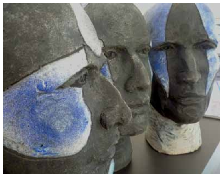
Monica Cantillana, Les sentinelles (détail).

Galerie Jacques Cerami Route de Philippeville 346 Charleroi jusq. 20-10 www.galeriecerami.be Prix : entre 750 (dessins) et 10.000 € (peintures)