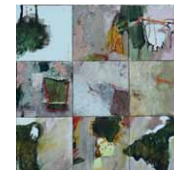
10 et 11 avril 12, 150 x 150 cm. © Jacques V. Lemaire

« L'apparence est un leurre... La peinture doit parler, au-delà des idées, au-delà de l'intelligence. » Ces mots de l'artiste résumant à eux seuls notre plongée en apnée dans l'univers de Jacques V. Lemaire. Pour en comprendre toute la portée, il ne suffit pas de regarder: il faut d'abord en pénétrer les strates. Cela demande un peu de volonté même si, très vite, on se laisse emporter. Ses œuvres sont alors comme autant de promenades spirituelles dont on ne connaît que le point de départ puisque, aussitôt parti, notre esprit s'égaré. La sélection proposée puise exclusivement dans les plus récentes créations... Coup de cœur pour ses œuvres composites dont les différentes parties peuvent à la fois être appréciées indépendamment de l'ensemble ou considérées dans une perspective plus large, à l'image d'une partition qui se lirait de préférence du haut vers le bas (même si aucune