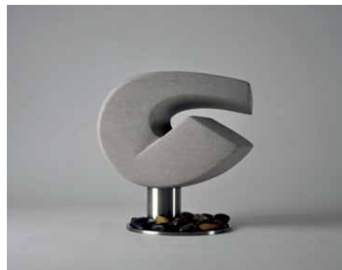
Marc Fugère, La Grande Pirouette.

Galerie Libre Cours Rue de Stassart 100 Bruxelles jusq. 20-10 www.galerielibrecours.eu Prix: entre 1.200 et 50.000 €