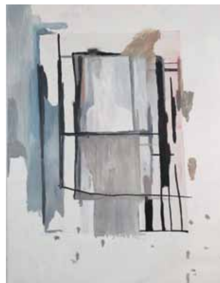
V, 1, 2012, huile sur toile, 200 x 150 cm. © Ronny Delrue

Vision floue ou l'art de brouiller les pistes ! Voilà tout le talent de Ronny Delrue. Né à Heestert en 1957, cet artiste solidement formé fait volontairement l'impasse sur tous les détails reconnaissables de la réalité. Dans une démarche prenant radicalement le contre-pied de toutes les autres, Ronny Delrue s'attaque à ses sujets de par l'intérieur, recourant à toute une palette de techniques pour parvenir à une plus grande universalité. « C'est surtout dans les dessins que cette mise en jeu intense du refus et de la gestuelle se manifeste le plus. Jouant sur la réflexion et la méditation avec lui-même, il y part à la recherche de l'identité cachée derrière lui-même. Les figures qui y apparaissent sont à la fois rapprochées et éloignées : rapprochées par leurs contours, éloignées comme apparition. (...) » (Jan Hoet, 2011) En d'autres termes, Delrue remodèle et modifie la réalité pour mieux troubler notre 'reconnaissance'. Autant de subterfuges qui mettent le spec-