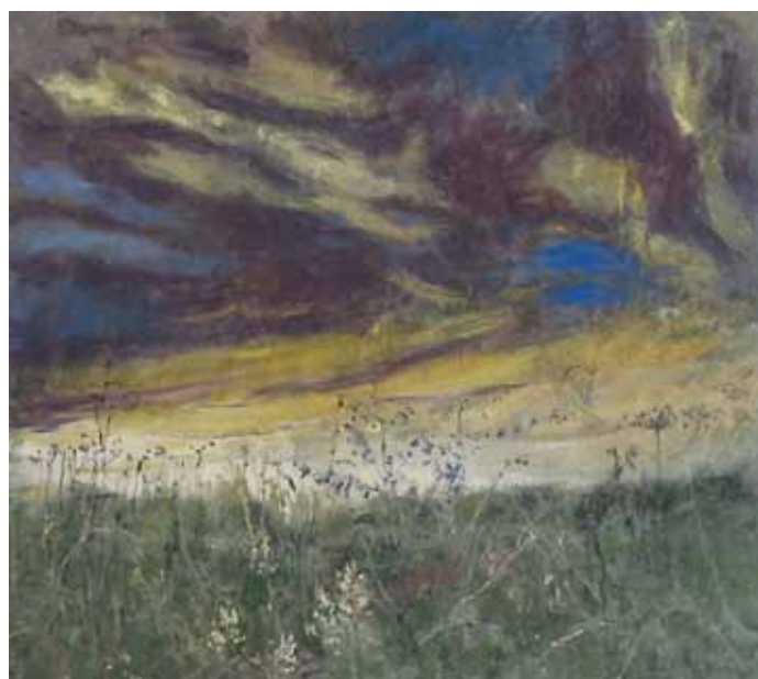
Champs, technique mixte sur toile, 2012, 130 x 150 cm © de l'artiste.