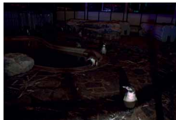
Peter Waterschoot, Pinguins at the Zoo, 2009. © Peter Waterschoot. Courtesy 44 Gallery, Bruges. Prix : entre 300 € et 950 €, formats de 25 à 120 cm de largeur, 8 tirages, montés sur dibond, avec ou sans cadre.